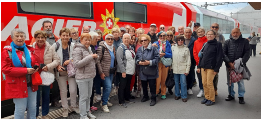
Nous étions 33, le 11 juin à nous retrouver à 6h30 à la gare St Charles pour un départ en car vers la Suisse.

Un magnifique voyage, certes un peu fatigant à cause des réveils matinaux ! De très belles visites :